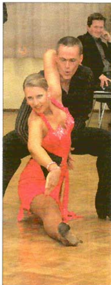
Am 3. Dezember tanzen die Paare wieder um den Weihnachtspokal.